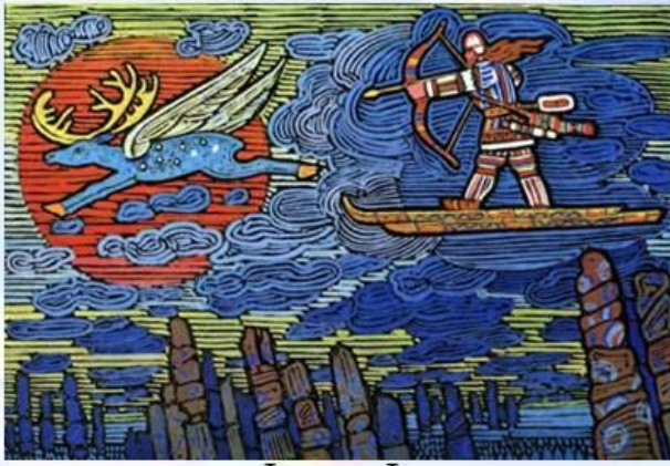
Миф о Ииркапе

Маленький друг! Прочитай Коми сказки, ты уже наверно понял, что в них можно встретить много интересных и необычных сказочных героев. Посмотри на картинки и подумай, какой сказке принадлежат эти иллюстрации?