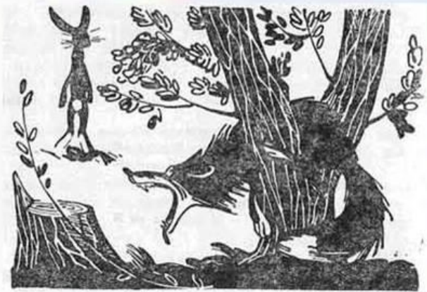
Лиса и заяц