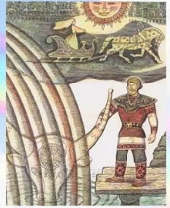
Пера и Зарань